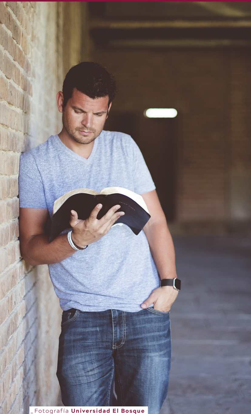
_ Fotografía Universidad El Bosque