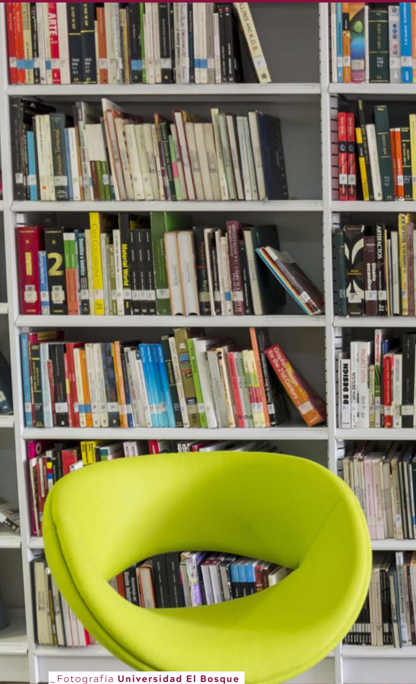
_ Fotografía Universidad El Bosque