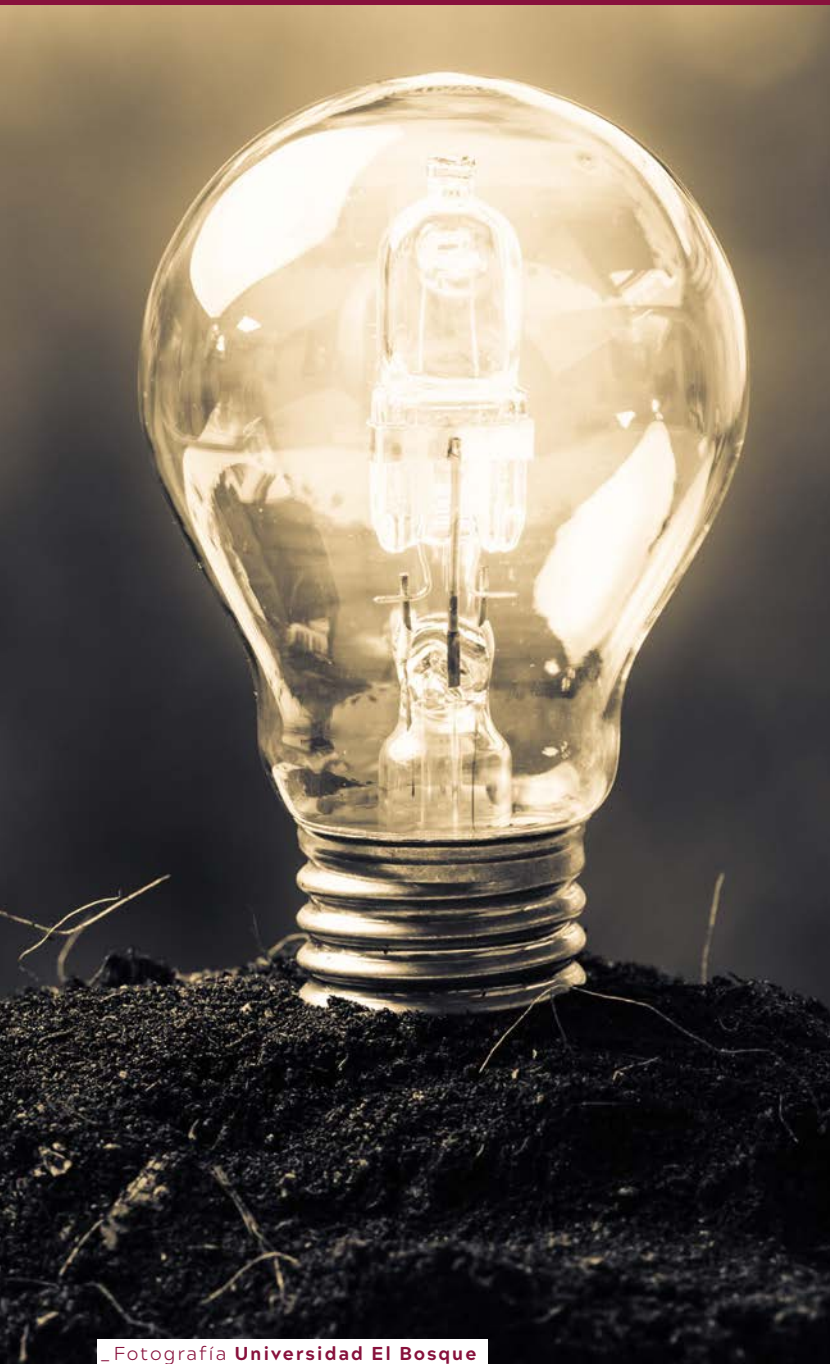
_ Fotografía Universidad El Bosque