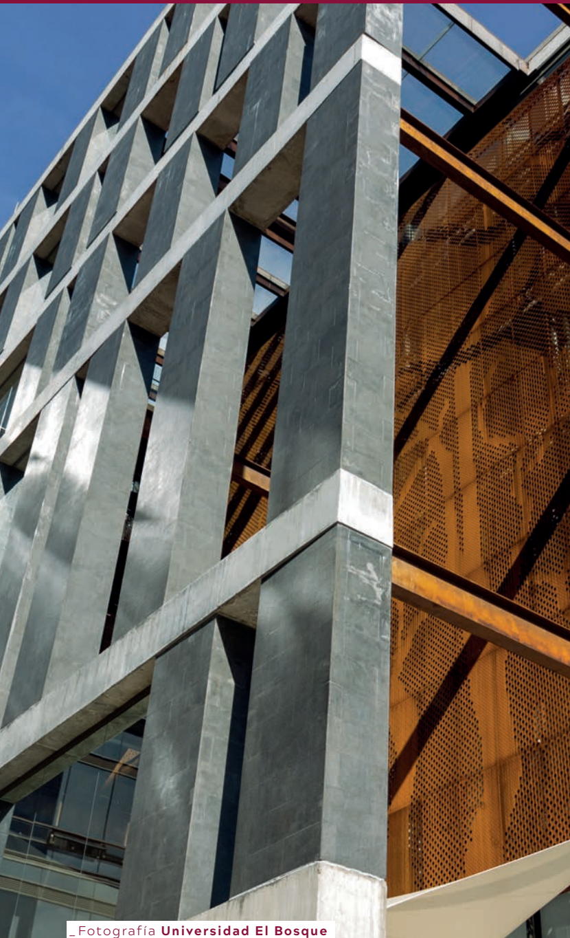
_ Fotografía Universidad El Bosque