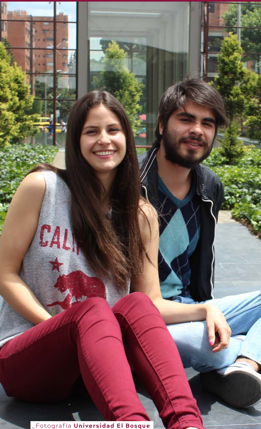
_ Fotografía Universidad El Bosque